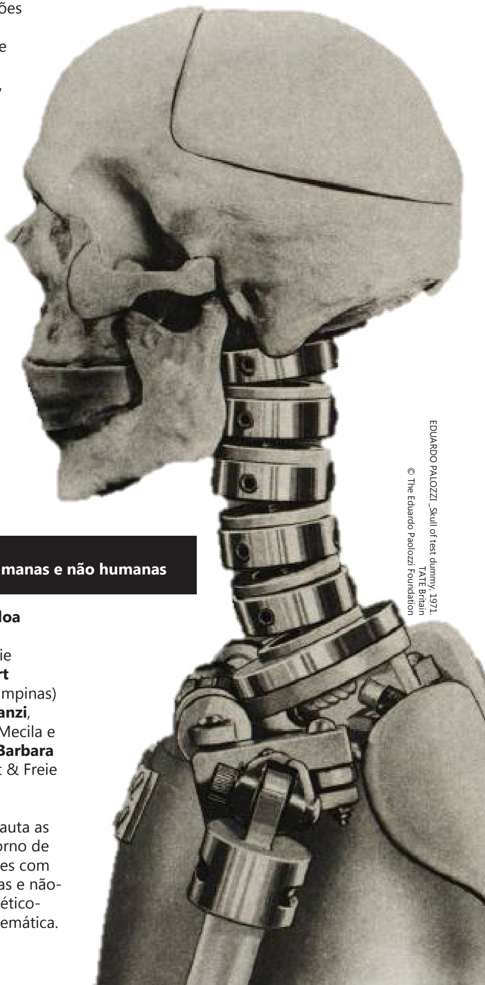
EDUARDO PALOZZI, 'Skull of test dummy', 1971. © The Eduardo Paolozzi Foundation TATE Britain

O evento irá explorar e colocar em pauta as principais inovações científicas em torno de tecnologias de protótipos humanoides com foco nas relações e vivências humanas e não-humanas, bem como as implicações ético-políticas que giram em torno dessa temática.