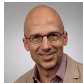
University of Luxembourg